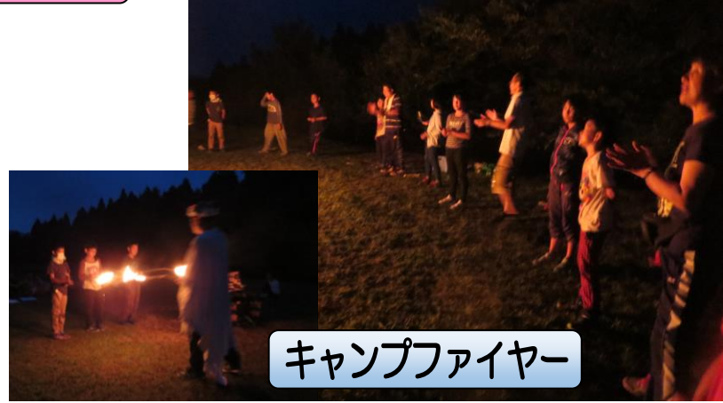
キャンプファイヤー