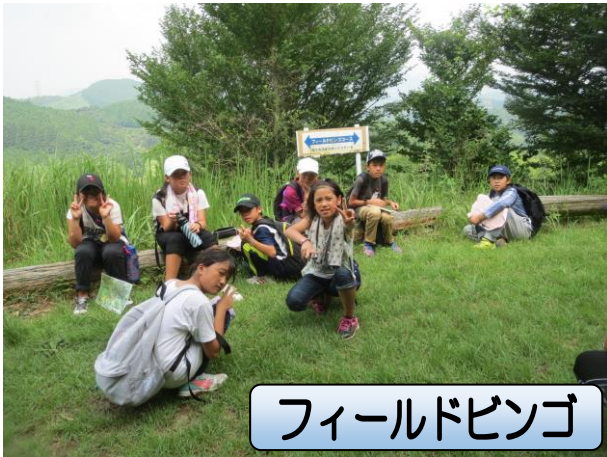
フィールドビンゴ