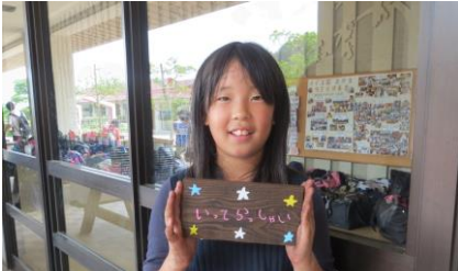
焼き杉の表札作り