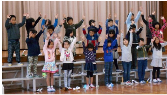
おんがく し き うた 2年・音楽「四季の歌」