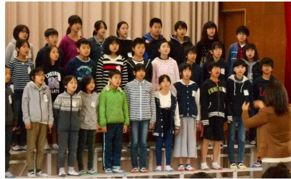
がっしょう 5. 6年・合唱 「クスノキ」「あすという日が」