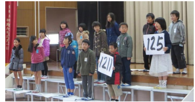
そうごう 3年・総合「おじいちゃん、おばあちゃんとの 交流を通して」