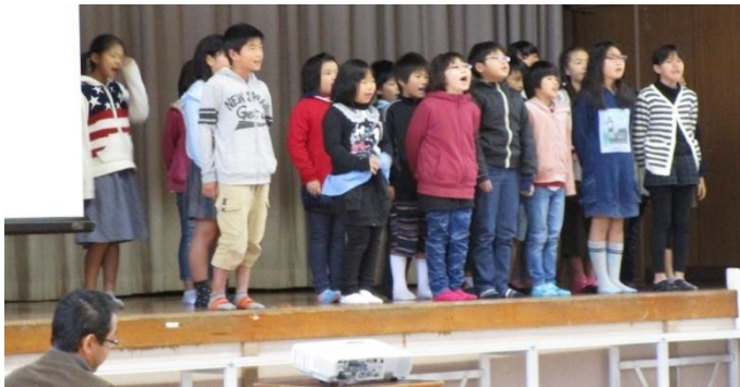
こくご せいほうしょうがっこう 4年・国語「わたしたちの青峰小学校」