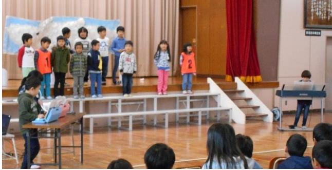
おんどくげき 1年・音読劇「くじらぐも」

いま かくしゅ せい か はっき がんば かくねん 今までの学習の成果を発揮して頑張りました。どの学年 もすばらしい発表でした。地域の方やおうちの方からもたく さんほめていただきました。