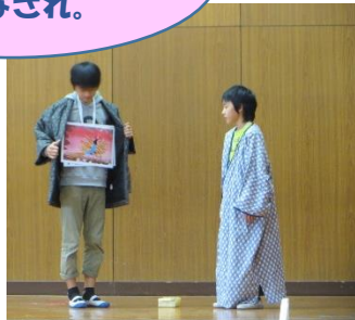
「かえるをのんだ ととさま」の劇