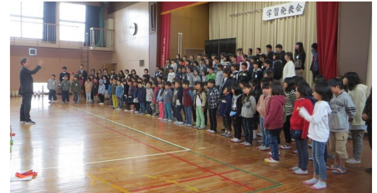
ぜんこうがっしょう 全校合唱 おんがく 「音楽のおくいもの」