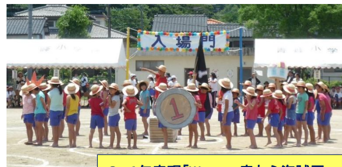
3, 4年表現「We are 麦わら海賊団」