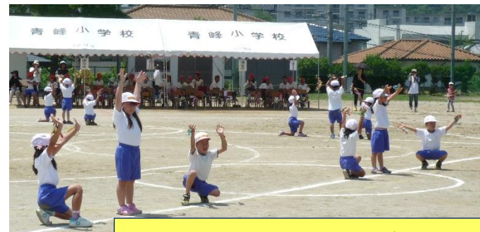
1, 2年表現「友よ～この先もずっと～」