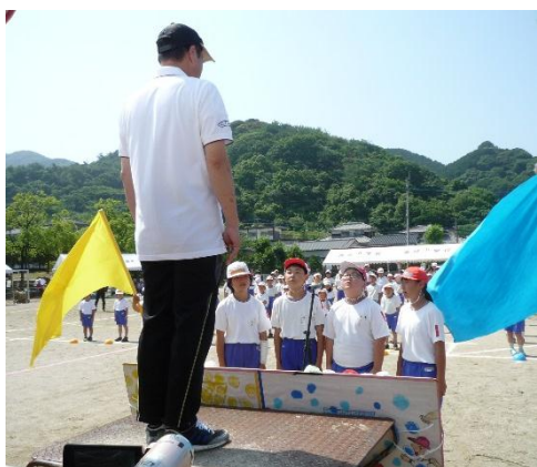
児童代表による「誓いのことば」