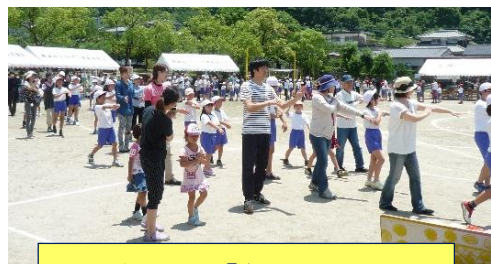
みんなで踊る「久留米小唄」