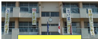
運動会スローガン

あめ ふつかかん えんき うんどうかい 雨のため、2日間も延期になった運動会で ぜんいよく だ がんばり したが、みんな全力を出して頑張りました。