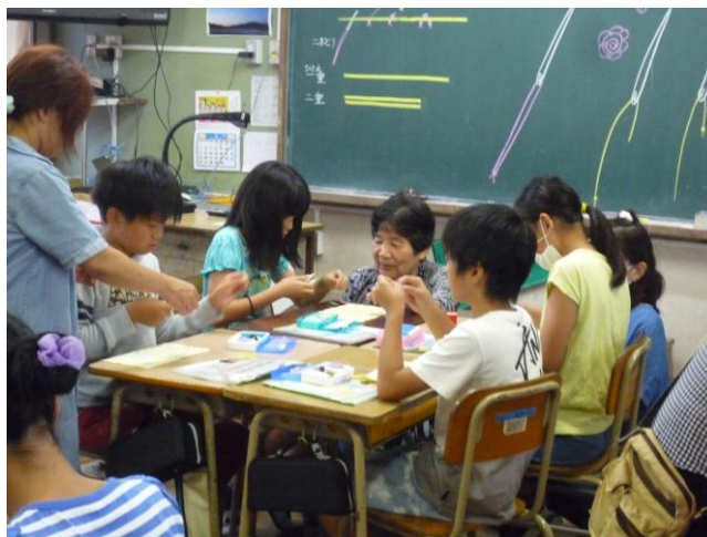
かてい 5年家庭「はじめてみよう、ソーイング」