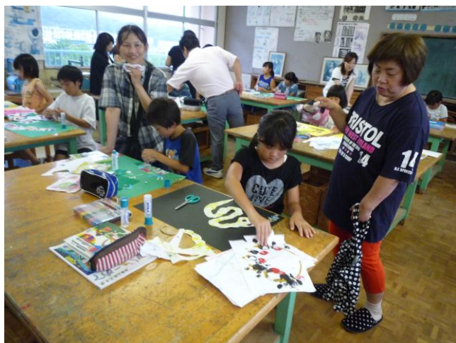
ずこう まよ 4年図工「アリスの迷いこんだ ふしぎの森を想像してつくろう」