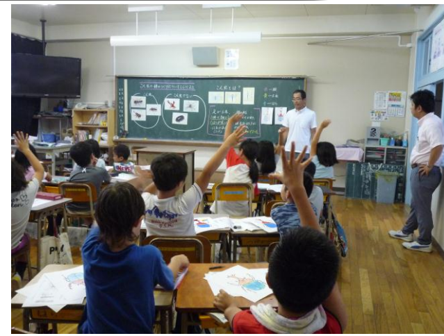
りか からだ 3年理科「こんちゅうの体のつくり」