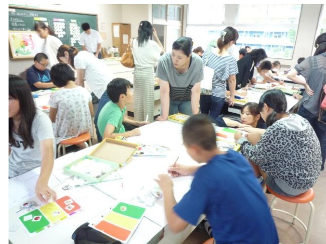
かてい あさ かんが 6年家庭「朝ごはんのメニューを考えよう」