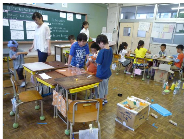
せいかつ じぶん つく 2年生活「自分でおもちゃを作ってみよう」