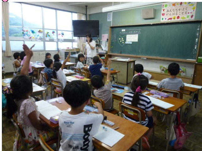
さんすう 1年算数「のこいはいくつ」

ことし かいめ がくしゅうさんかん 今年、2回目の学習参観でした。みんな集中して取り組み ました。お家の方と一緒にする活動もありました。