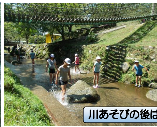
川あそびの後は、おいしいすいかです!