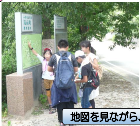
地図を見ながら、フィールドビンゴ