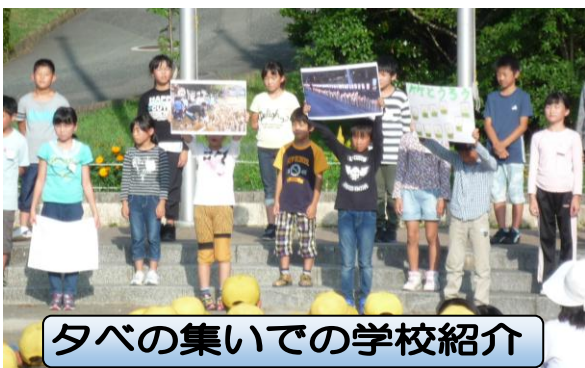
タベの集いで学校紹介