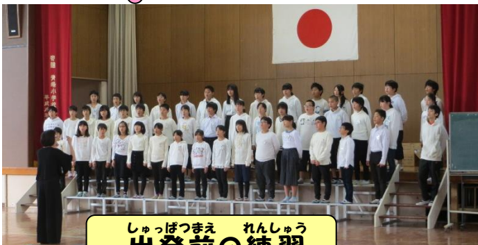
しゅっぱつまえ れんしゅう 出発前の練習