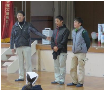
せいねんぶ JA青年部のみなさん